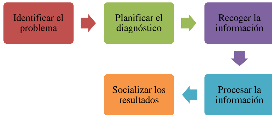
Figura 3. Cuadro del proceso del diagnóstico participativo

Será el seguimiento pormenorizado de cada una de ellas lo que derive en el acierto de los resultados, como insumo prioritario para la planificación del destino.