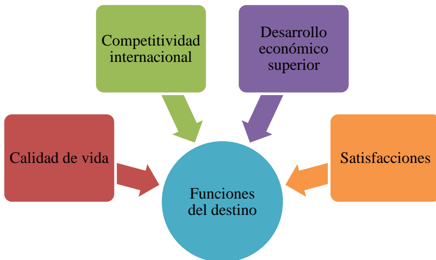
Figura 1. Cuadro de funciones del destino turístico

Otro aporte de importancia es la especificación de los objetivos que todo destino debe de seguir para cumplir con su función inicial. Al respecto Valls (2004) señala que sus funciones vendrán definidas por los objetivos a cumplir, ya sean estos basados en estructuras sociales, urbanísticas, culturales, etc. (Figura 1). En este sentido, las mencionadas funciones se conseguirán únicamente si el sitio es diseñado para satisfacer los deseos de sus visitantes y de sus habitantes, a través de vivencias que superen sus expectativas. Por tanto, el propósito final y primordial al que apuntan los destinos turísticos y que se logra de la total consecución de las tales funciones, es la satisfacción. No obstante, esta está condicionada de acuerdo a la generalidad del entorno (económico, político, legal, social); y a la asociación directa del turista hacia la oferta.