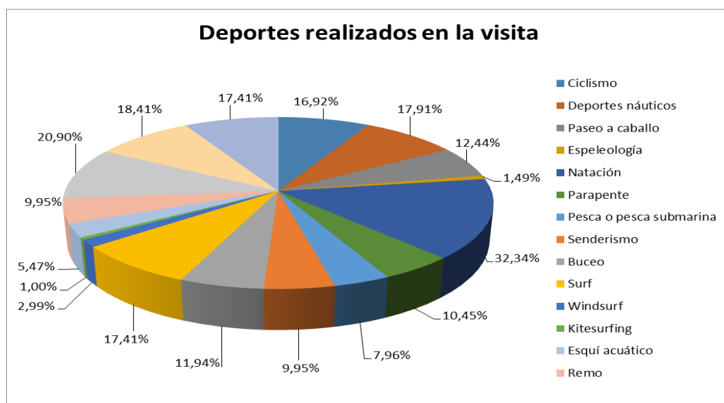
Figura 1. Gráfico pastel de los las actividades realizadas en Salinas. Se observa las actividades más efectuadas en los emplazamientos.

A continuación, se les realizaron dos preguntas, una a las personas que hubiesen realizado algún deporte sobre el tipo de estos y otra a todos los encuestados sobre su deseo de realizar estas actividades.