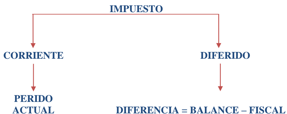
Gráfico 2: Efectos tributarios