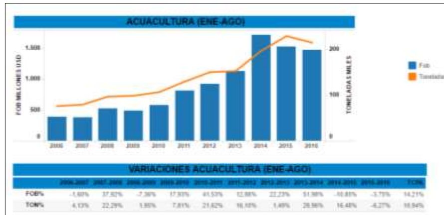
Figura 1: Evolución de las exportaciones no petroleras por sector