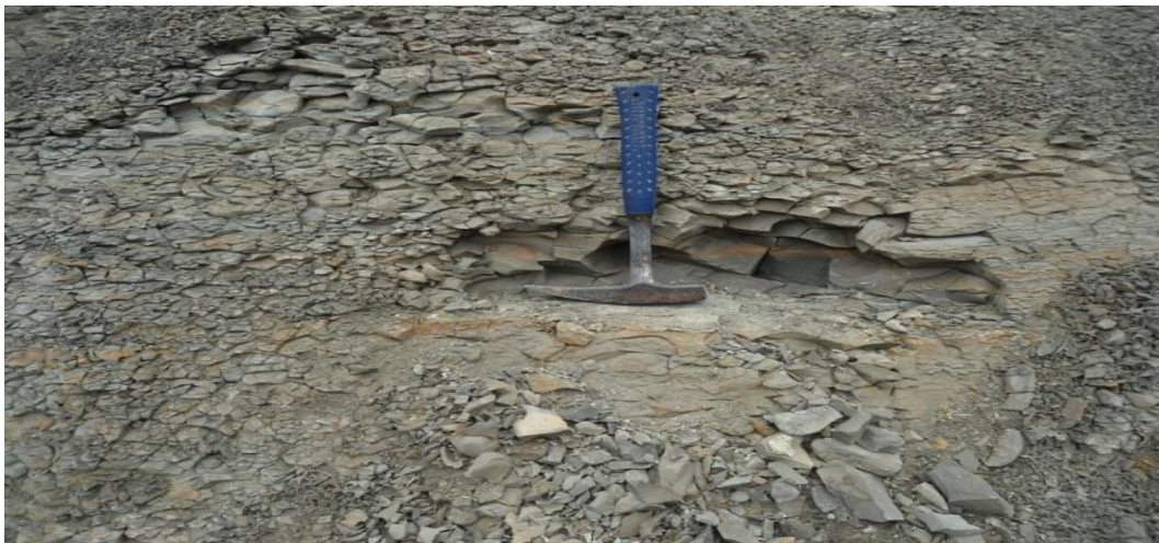
Foto 7.- Roca arcillo-limosa de la formación Onzole.

Se encuentra en las paredes de los canales de drenaje del deslizamiento.