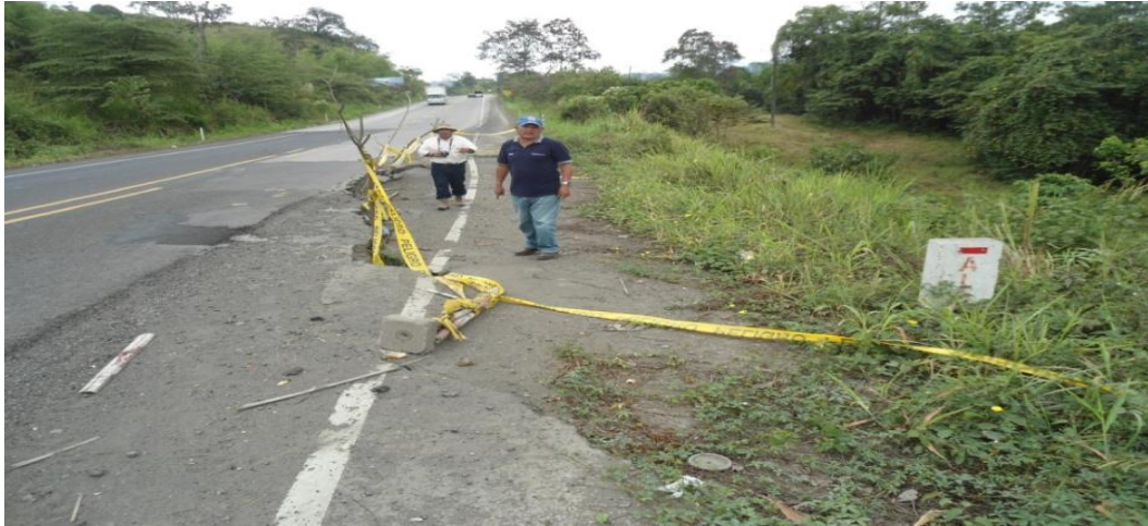
Foto 14.- Abscisa 36+520. Hundimiento del pavimento en la vía Chone-Flavio Alfaro.

Se trata de un hundimiento-deslizamiento del relleno de la vía alrededor de la boca de salida de la alcantarilla que permite el flujo de un pequeño cauce de un río que solo corre en invierno en presencia de las aguas lluvias.