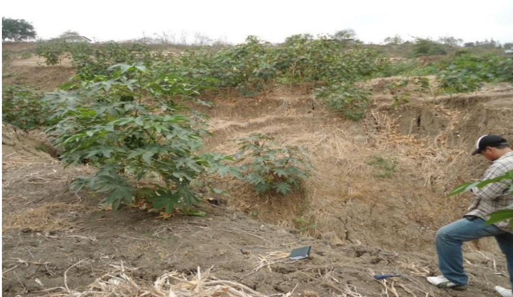
Foto 3.- Vista hacia arriba del cuerpo del deslizamiento Junco.