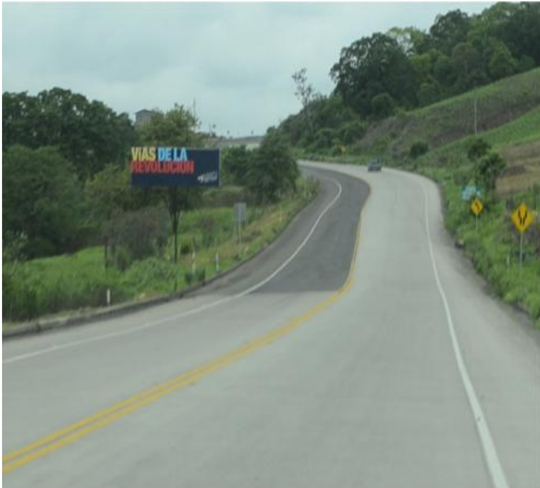
Carpeta asfáltica colocada en el carril izquierdo (2km).

Es de suma importancia aclarar que el suelo del norte de Manabí contiene en grandes cantidades arcillas expansivas, eso agrava las fisuras debido a que no se tomó en cuenta este factor y dificultando el estado actual de la vía.