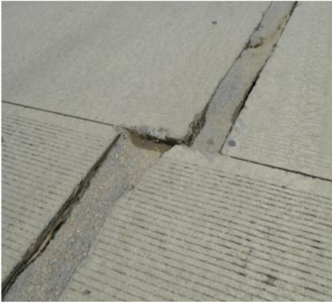
Fisuras longitudinales reparadas con Resina de Polimeros.

Estas fisuras tienen una longitud variada entre 3 y 30 m. En invierno hay sobresaturación de la capa subrasante y en verano se secan, al tener un tráfico pesado empeora la situación provocando grietas. Estas fisuras han sido reparadas se hicieron canales de 10 cm de ancho y se colocó Resina de polímeros modificada que se vierte en caliente para reparación de hormigón.