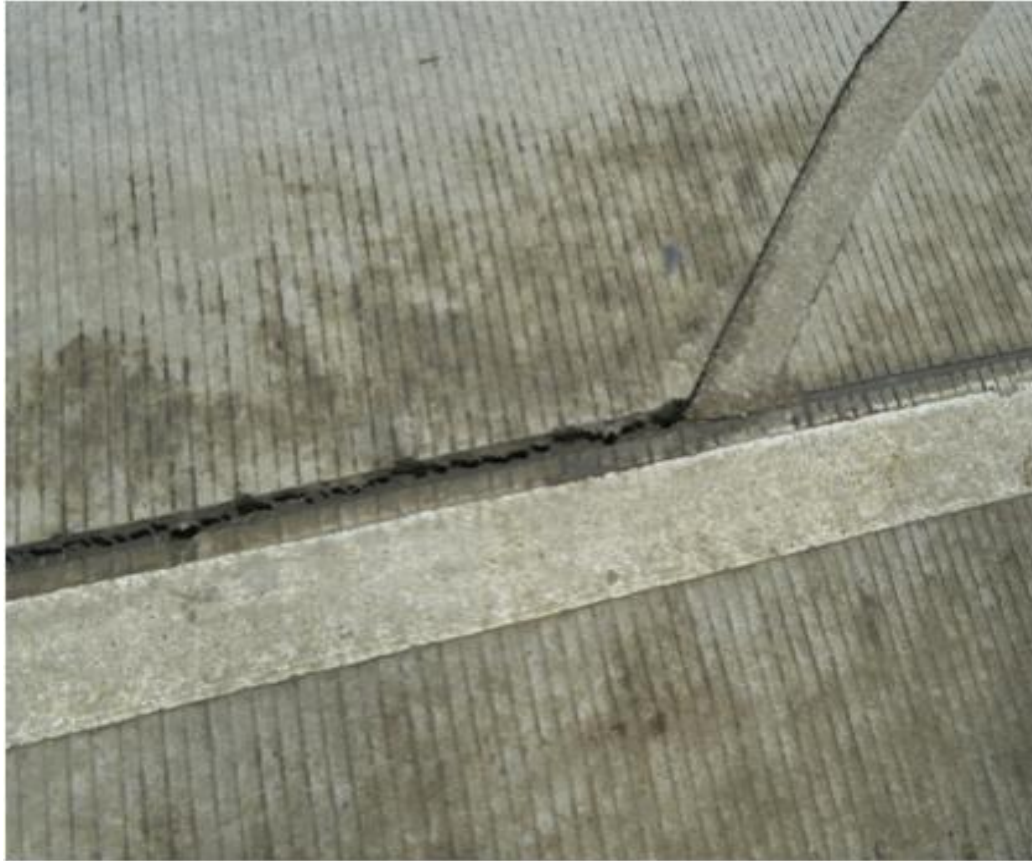
Diferencia de nivel a través de las juntas.