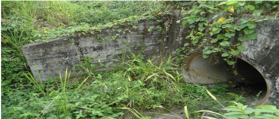
Foto 15.-Entrada de la alcantarilla por donde pasa el cauce de un pequeño río de invierno.

6 m de potencia y bajo esta capa se encuentra la roca arcillosa muy meteorizada de la formación Onzole hasta por lo menos unos 4 m y más abajo las rocas blandas arcillo-limosas de dicha formación.