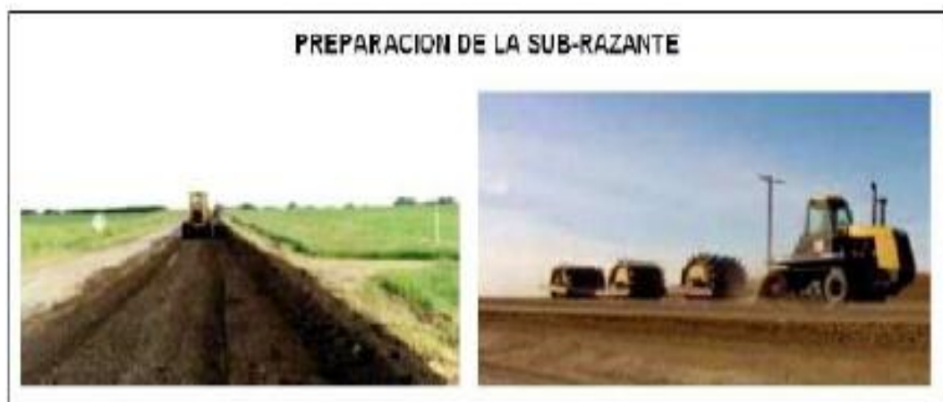
Figura N° 3 Etapas para la preparación de la subrasante

Con respecto a los materiales que constituyen la capa subrasante, necesariamente deben utilizarse suelos compactables y obtener por lo menos el 95% de su grado de compactación. Compactables con CBR > 15 .