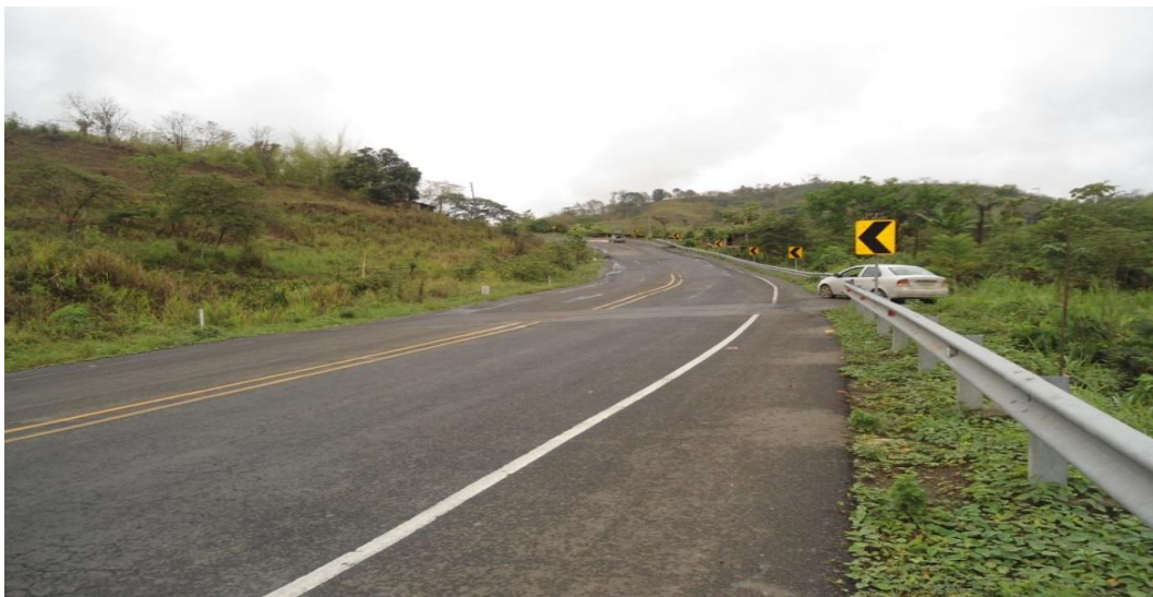
Foto 10.- Vista del deslizamiento en los dos puntos de corte actual a lo largo de la vía.

Se trata de un antiguo problema de inestabilidad que comenzó en el año 1998 durante la aparición del último Fenómeno de El Niño, el cual causó muchos estragos sobre las vías de la costa al igual que el del año 1983. Desde entonces el problema ha sido tratado de solucionar por el MTOP, habiendo efectuado en su momento enormes movimientos de tierra deslizada.