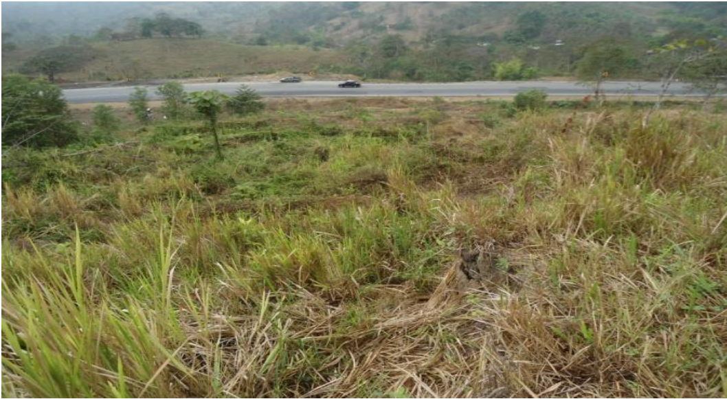
Foto 6.- Cuerpo del deslizamiento visto desde la corona.