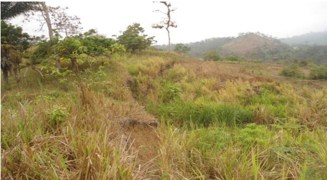
Foto 5.- Corona del deslizamiento a la izquierda

En las rocas arcillosas hemos visto en varios otros sitios como comúnmente se asocian con los fenómenos de erosión de los suelos los deslizamientos de todas las magnitudes posibles de acuerdo a la geomorfología del sitio. En este caso se encuentra un deslizamiento cuyo espesor ha sido removido en un 40% en especial desde la pata hacia cerca del centro del cuerpo.