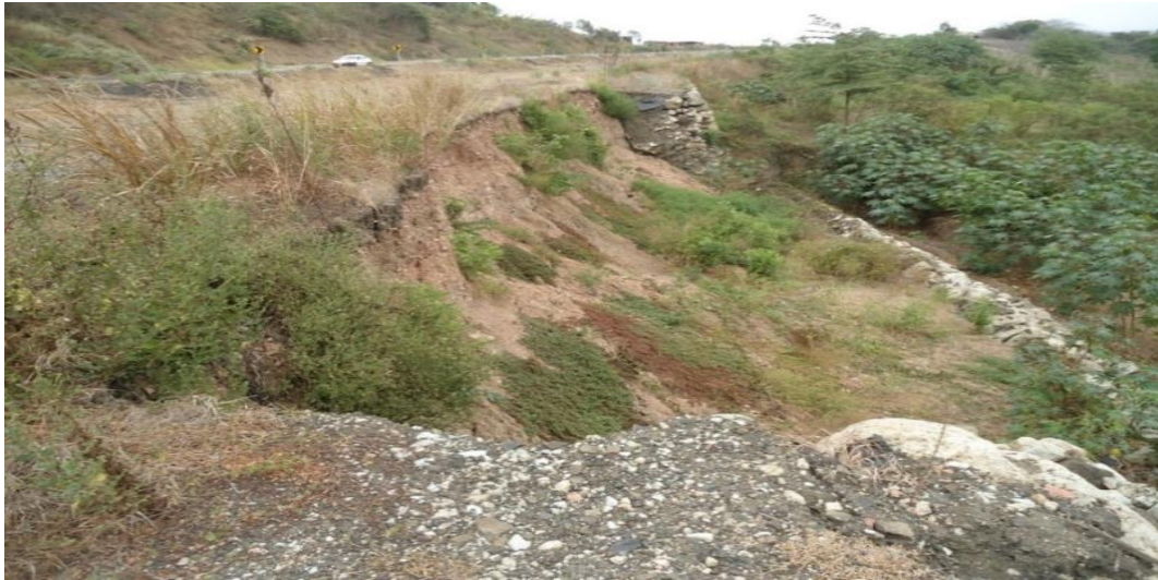
Foto 1.- Corona del deslizamiento El Junco.