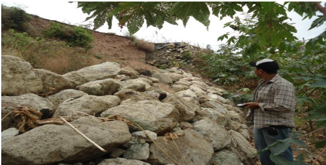
Foto 2.- Muro de piedras colapsado.

Se observa en la parte alta la capa de relleno de 3 m de espesor y a la derecha el resto del muro de piedras aún no colapsado, pero que se encuentra ya bastante agrietado.