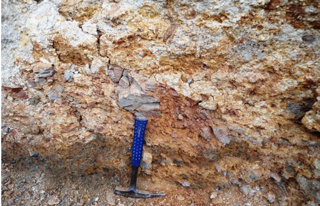
Foto 8.- Textura de las capas superficiales deslizadas que se conservan cerca de P2.

Las rocas arcillo-limosas muy blandas de la formación Onzole que afloran frente a la vía en el sitio donde se ha removido el material deslizado, presentan estratos en apariencia masivos, pero muy fracturada en pequeños fragmentos sin planos definidos.