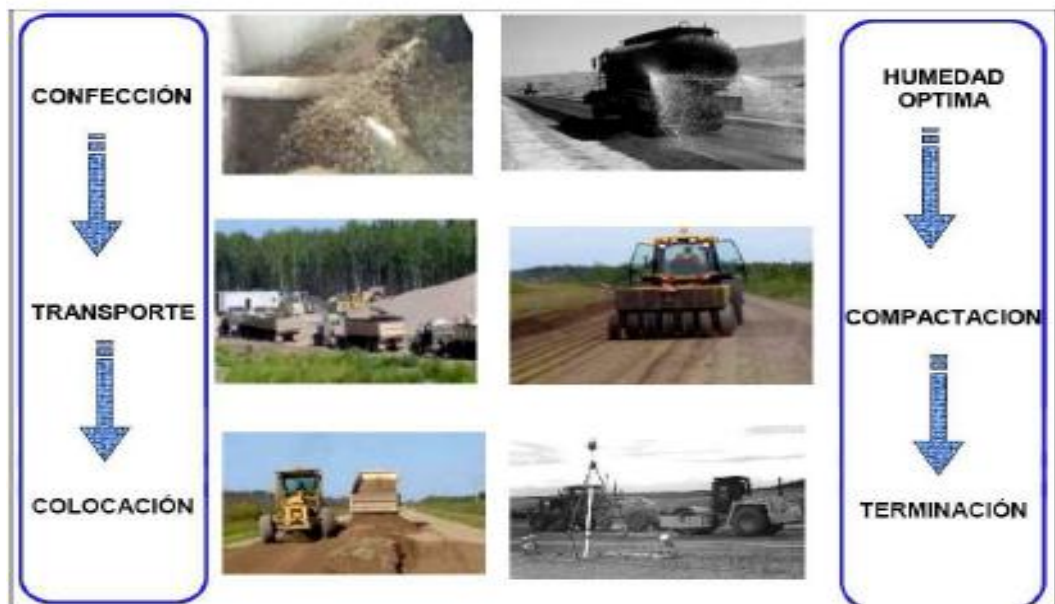
Figura N° 2 Etapas para la preparación de la base

“La Capa que se encuentra situada debajo de la carpeta (pavimento flexible) se la emplea para absorber la mayor parte de los esfuerzos verticales, respondiendo adecuadamente al tránsito pesado gracias a su rigidez y su resistencia a la deformación”