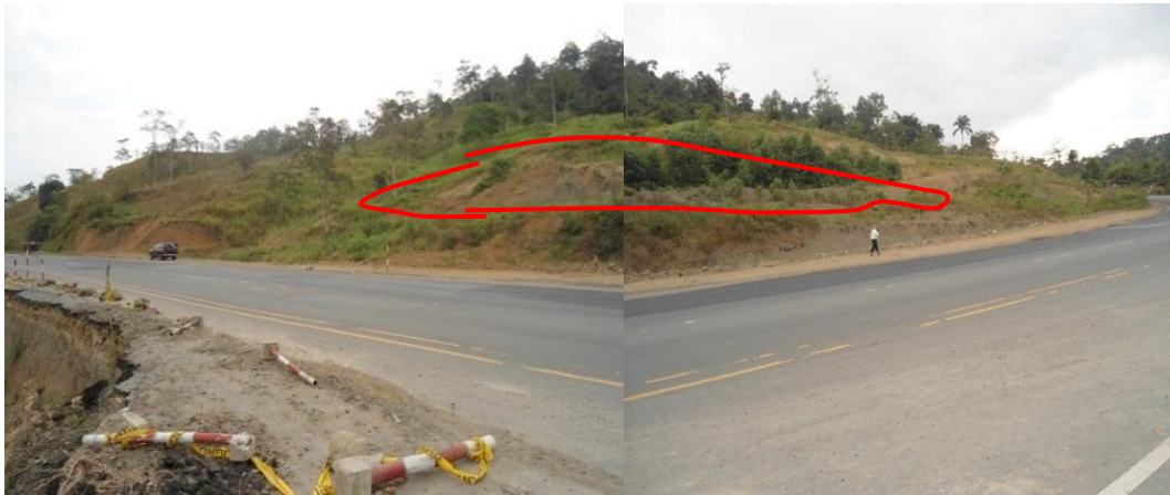
Foto 4.- Área de deslizamiento no removido.

En las rocas arcillosas hemos visto en varios otros sitios como comúnmente se asocian con los fenómenos de erosión de los suelos los deslizamientos de todas las magnitudes posibles de acuerdo a la geomorfología del sitio. En este caso se encuentra un deslizamiento cuyo espesor ha sido removido en un 40% en especial desde la pata hacia cerca del centro del cuerpo.